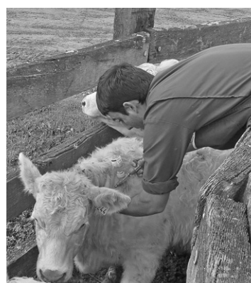
La manipulation des bovins au quotidien permet d'acquérir des gestes sûrs.

Les cours techniques sont assurés par des intervenants experts dans le domaine, des professionnels qui s'appuient sur les connaissances actuelles mais également les innovations et expériences réalisées en fermes expérimentales. De nombreuses visites d'exploitations permettent d'illustrer les apports théoriques et techniques. Les modules nécessitant de la pratique sont réalisés directement sur l'une des 4 fermes expérimentales ou dans des ateliers de transformation.